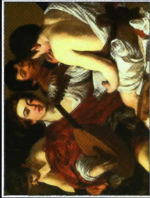
Caravaggio, Concerto di giovani

E come a buon cantor buon citarista fa seguir lo guizzo de la corda, in che più di piacer lo canto acquista, sì, mentre ch'è parlo, sì, mi ricorda ch'io vidi le due luci benedette, pur come batter d'occhi si concordò, con le parole mover le fiammette.